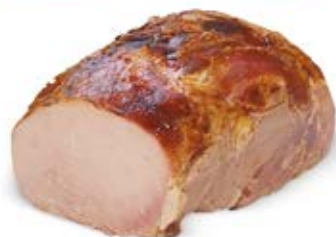
SZYŃKA PIECZONA Z BOBROWNIK