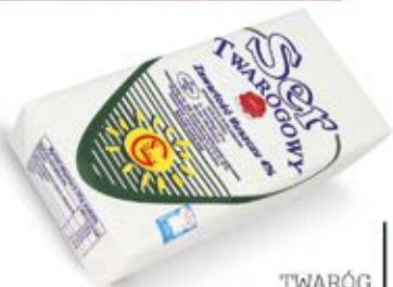
TWARÓG PÓŁTŁUSTY KRAJANKA