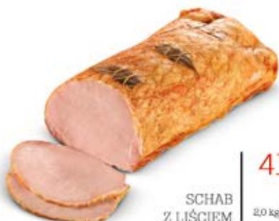
SCHAB Z LIŚCIEM