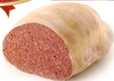
KASZANKA NA PATELNIĘ