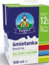
ŚMIETANA UHT 12%