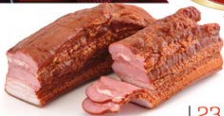
BOCZEK SZLACHECKI PASKI PARZONY