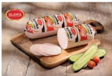
SZYŃKA BIAŁA Z INDYKA