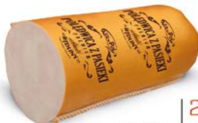
POŁĘDWICA Z PASIEKI