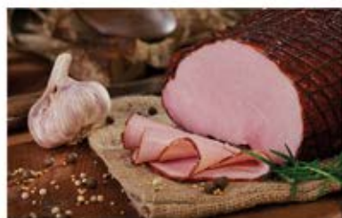
SZYNKĄ JAK ZE WSI