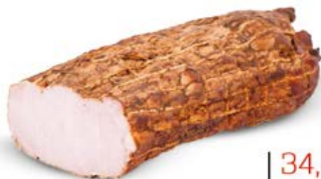
SCHAB NIE ZE WSI