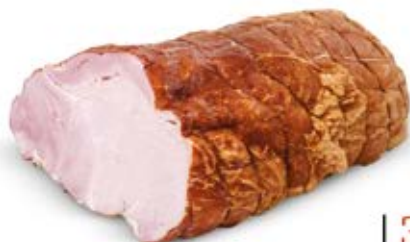
SZYNKĄ OD GÓRALI