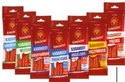
KABANOSY W ASORTYMENCIE