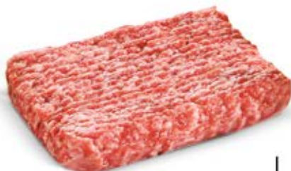
MIEŚO NA KOTLETY WIEPRZOWE