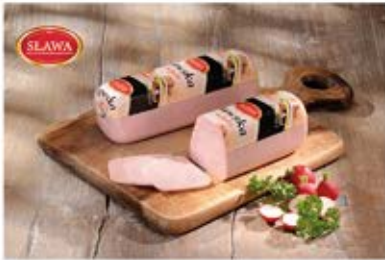
SŁAWSKA Z INDYKA