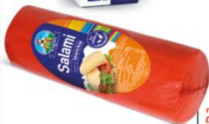
SER SALAMI BLOK