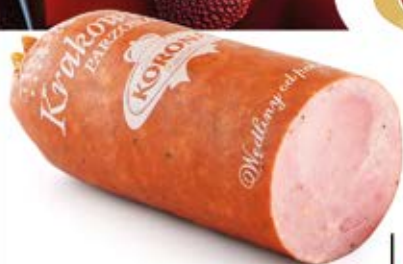
KIEŁBASA KRAKOWSKA PARZONA