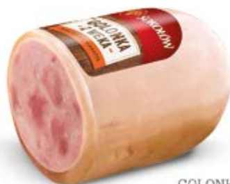
GOLONKA Z WEKA