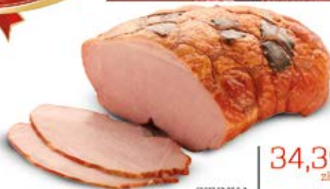
SZYNKA Z LIŚCIEM