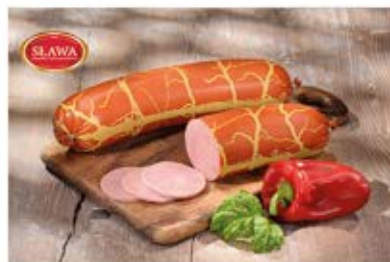
BALERON Z INDYKA