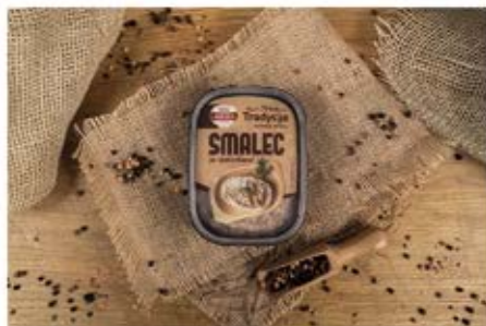
SMALEC ZE SKWARKAMI