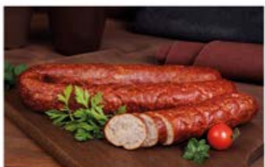
KIELBASA KRUCHA Z CIELECINĄ