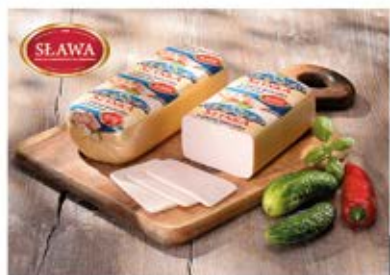
SZYŃKA Z PIERSI KURCZAKA PRASOWANA