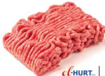
el-HURT Niezawodny Partner MIĘSO NA KOTLETY Z ŁOPATKI