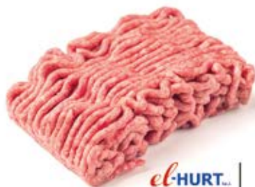
el-HURT Niezawodny Partner MIĘSO NA KOTLETY Z DROBIEM