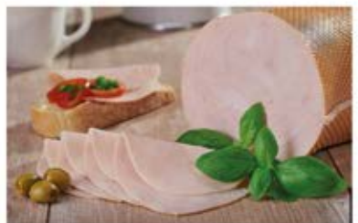
KURCZAK GOTOWANY PREMIUM