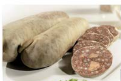
KASZANKA GRUBA EXTRA