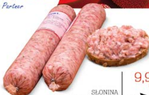
SŁONINA Z PRYZPRAWAMI