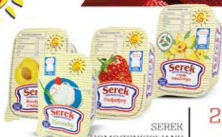
SEREK HOMOGENIZOWANY W ASORTYMENCIE