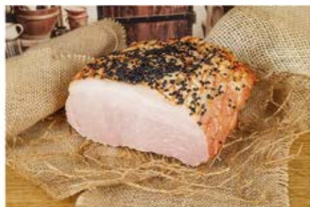
SZYNKA NA MAŚLE Z CZARNUSZKĄ