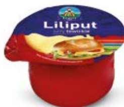
SER LILIPUT 350G