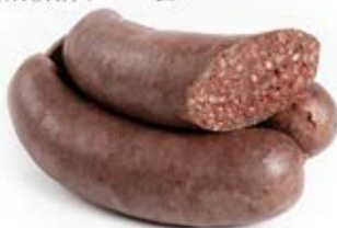
KASZANKA Z CZOSNKIEM