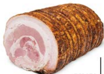
ROLADA Z ZAPIECKA