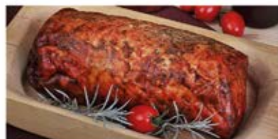
SCHAB PIECZONY Z PIECA