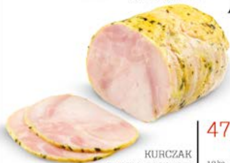
KURCZAK Z NUTĄ CZOSNKU