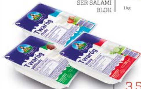
TWARÓG KOSTKA 200G CHUDY, PÓŁTŁUSTY, TŁUSTY