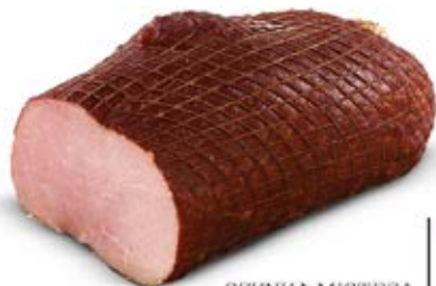
SZYNKA MISTRZA KOŁODZIEJA