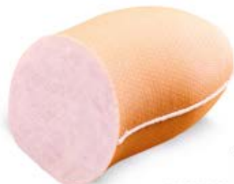
KURCZAK Z BOBROWNIK