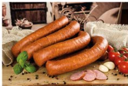
KIELBASA TORUŃSKA PREMIUM