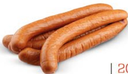
NASZA KIELBASA PODLASKA