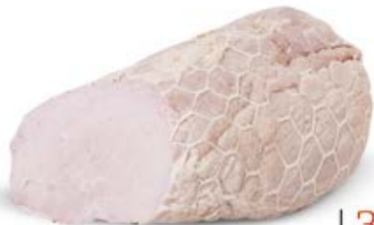
SZYNKĄ BEZ DYMUSIA