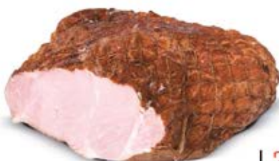
PAJDA Z MASARSKIEGO STRAGANU