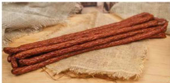
KABANOS ZE STARÓWKI