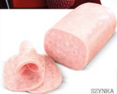
SZYŃKA WIEPRZOWA MIELONA