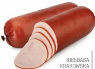
KIEŁBASA KRAKOWSKA Z FILETA