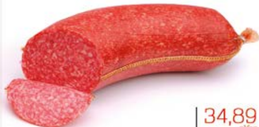
SALAMI BOOMERANG PREMIUM