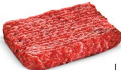
MIEŚO NA KOTLETY WIEPRZOWO-WOŁOWE