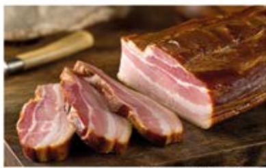
BOCZEK SUROWY WĘDZONY PASEK