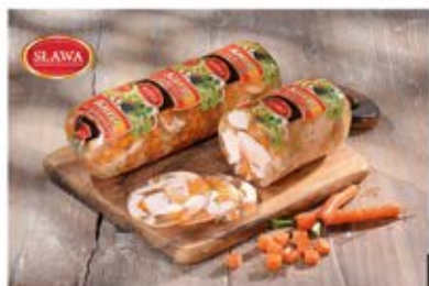
KURA W GALARECIE