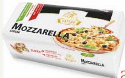
MOZZARELLA BLOK 1 kg