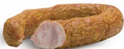
KIEŁBASA TRADYCYJNIE WYRABIANA