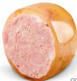
GOLONKA W GALARECIE