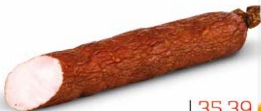
SUCHA PIECZONA ZE SPICHRZA