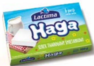
ŚMIETANKOWY SEREK TWAROGOWY HAGA 100 g