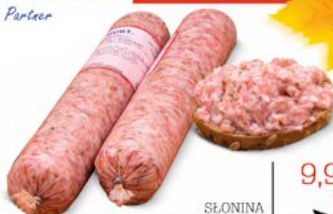
SŁONINA Z PRYZPRAWAMI