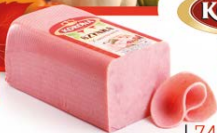
SZYNKI KONSERWOWA 6 LBS 875 kg VAC