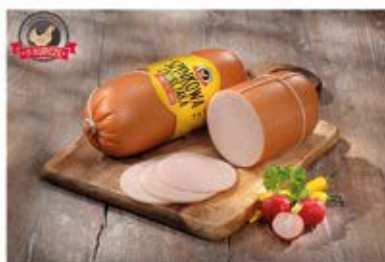
SZYNKOWA Z KURCZAKA