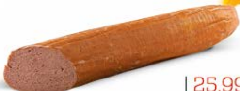
LEBERKA Z BORÓW