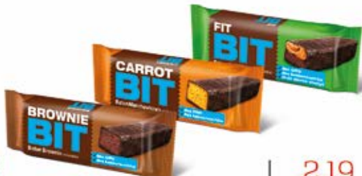
BATON W POLEWIE Z CIEMNEJ CZEKOLADY TRZY SMAKI: FIT BIT, BROWNIE, CARROT 40 g