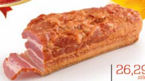
BOCZEK SZLACHECKI PASKI WĘDZONY