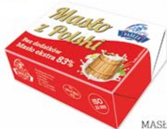
MASŁO Z POLSKI 200 g