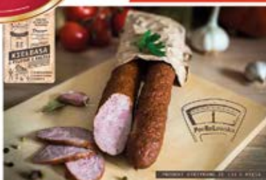
KIEŁBASA Z FILETEM KACZKI