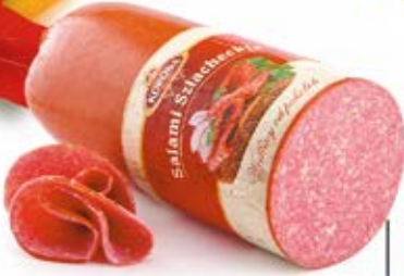
SALAMI SZLACHECKIE 2,0 kg MAP