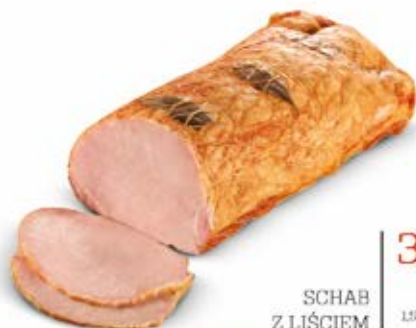
SCHAB Z LIŚCIEM