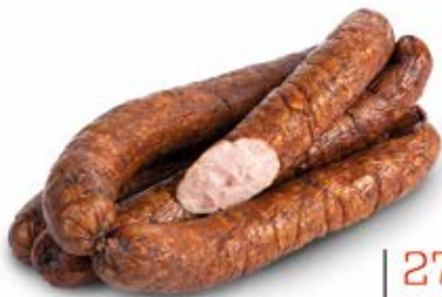
KIEŁBASA ZE SPIŻARNI 1,0 kg MAP