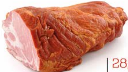
BALERON 1/2 15 kg VAC