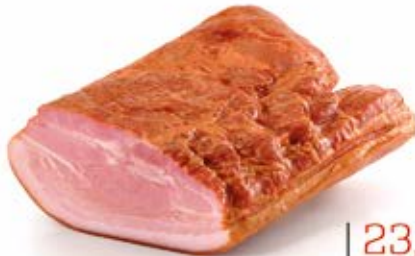
BOCZEK PARZONY EXTRA 1/2 25 kg VAC