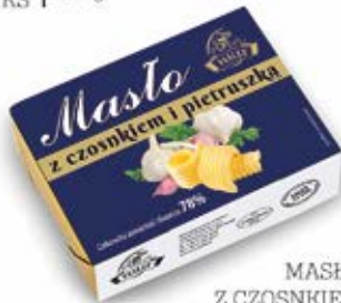
MASŁO Z CZOSNKIEM 150 g