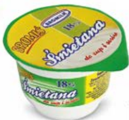
ŚMIETANA UKWASZANA 180 g