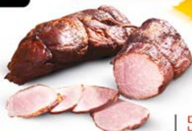
POŁĘDWICZKA ZE SPICHRZA