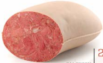
SALCESON SZLACHECKI EXTRA 2,0 kg VAC