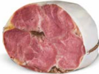
OZORKI GOTOWANE 1,5 kg VAC