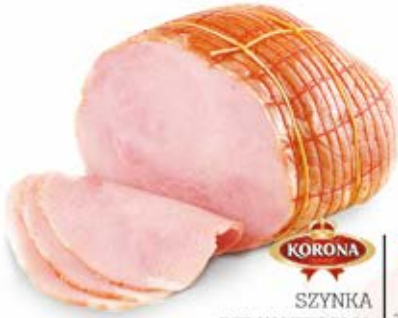
SZYNKI DELIKATESOWA 3,0 kg VAC