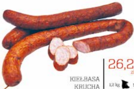
KIEŁBASA KRUCHA 1,2 kg MAP