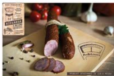
KIEŁBASA Z GĘSINĄ