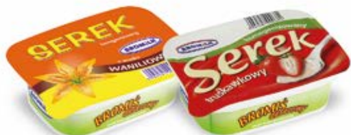
SEREK HOMOGENIZOWANY WANILIA, TRUSKAWKA 150 g