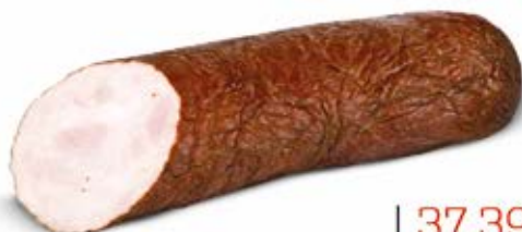
KRAKOWSKA PIECZONA ZE SPICHRZA