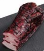
BOCZEK DĘBOWY PASKI