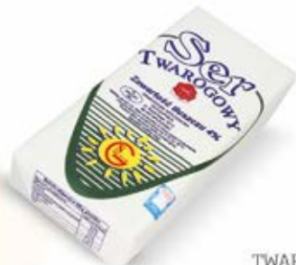
TWARÓG PÓŁTŁUSTY KRAJANKA 1 kg