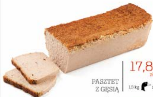
PASZTET Z GĘSIĄ