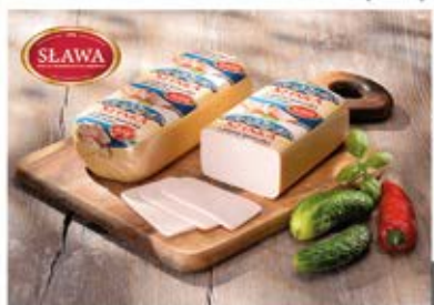
SZYNKA Z PIERSI KURCZAKA PRASOWANA