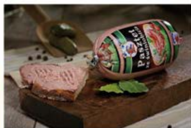
PASZTET ZE ŚWINIOBICIA