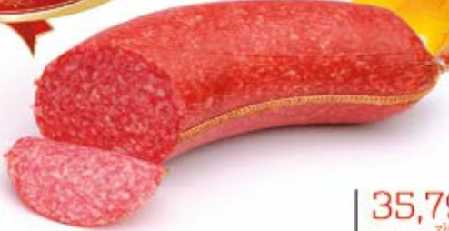
SALAMI BOOMERANG PREMIUM 1,0 kg MAP