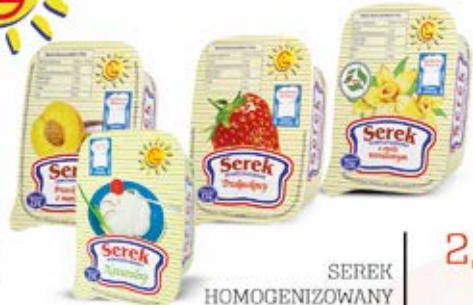
SEREK HOMOGENIZOWANY W ASORTYMENCIE 200 g