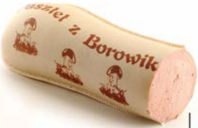
PASZTET BOROWIKOWY 1,0 kg VAC