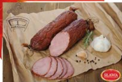
KRAKOWSKA SUCHA PEERELOWSKA