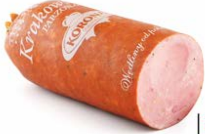
KIEŁBASA KRAKOWSKA PARZONA 2,0 kg MAP