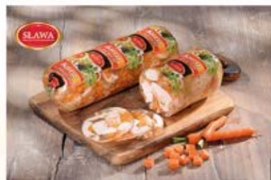
KURA W GALARECIE