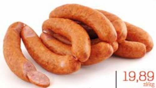
KIEŁBASA ŚLĄSKA REGIONALNA