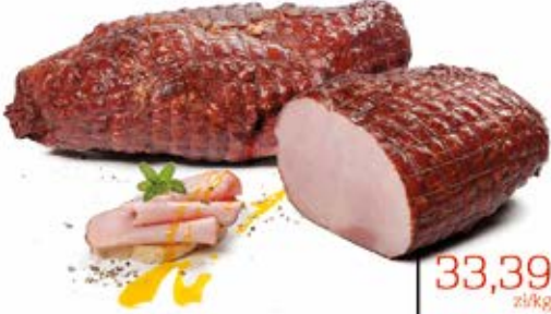
SZYNKA KRUCHA 2,0 kg MAP