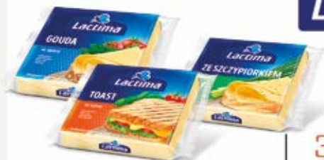
SER TOPIONY PŁASTRY W ASORTYMENTCIE 130 g