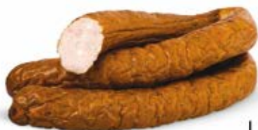
DROBIOWA ZE WSI