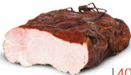
SZYŃKA Z WĘDZOKA