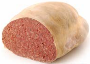
KASZANKA NA PATELNIĘ 1,0 kg VAC