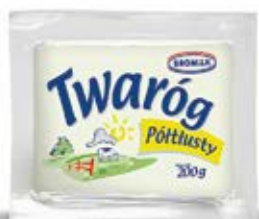
TWARÓG PÓŁTŁUSTY 200 g