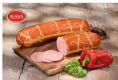
BALERON Z INDYKA