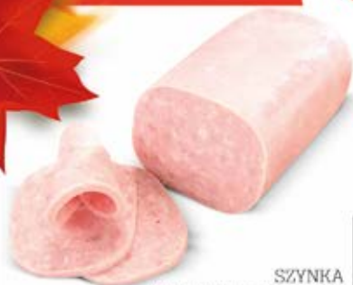
SZYŃKA WIEPRZOWA MIELONA