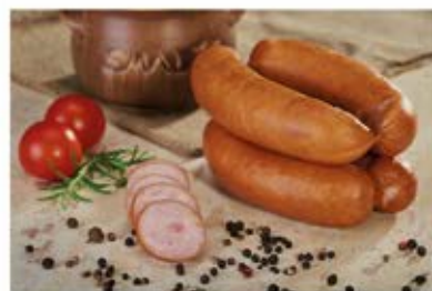
KIEŁBASA ŚLĄSKA EXTRA