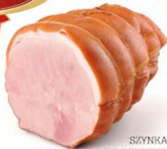
SZYNKI SZLACHECKA 15 kg VAC