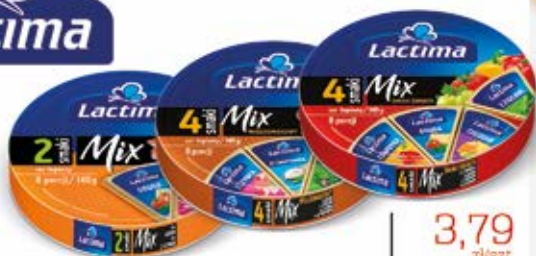
SER TOPIONY KRAZEK W ASORTYMENTCIE 140 g