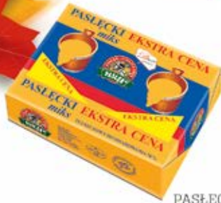
PASLECKI MIKS 200 g