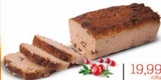
PASZTET Z ŻURAWINĄ