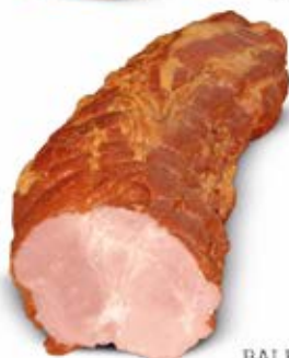
NASZ BALERON 1/2