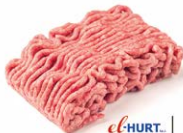
el-HURT Niezawodny Partner MIĘSO NA KOTLETY Z DROBIEM