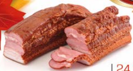
BOCZEK SZLACHECKI PASKI PARZONY