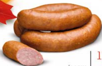
ŚLĄSKA Z WOŁOWINĄ