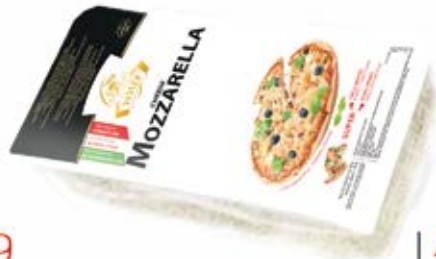
SER MOZZARELLA KOSTKA 2 kg