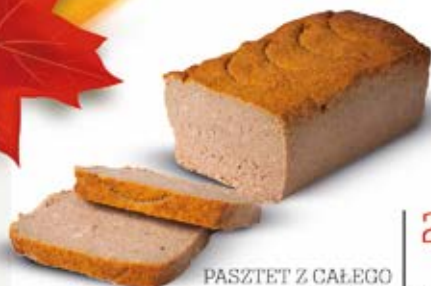
PASZTET Z CAŁEGO KURCZAKA