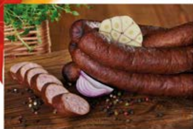
KIEŁBASA PO GÓRALSKU