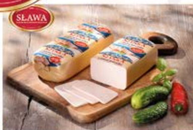
SZYŃKA Z PIERSI KURCZAKA PRASOWANA