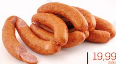
KIEŁBASA ŚLĄSKA REGIONALNA