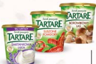
TARTARE W ASORTYMENCIE 140 g