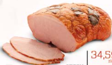
SZYNKA Z LIŚCIEM