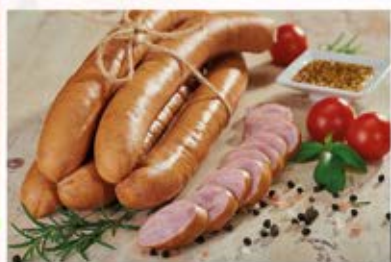
KIEŁBASA NA RUSZT