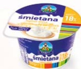
ŚMIETANA 18% 200g