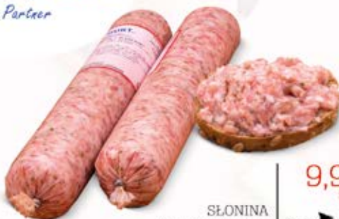
SŁONINA Z PRYZPRAWAMI