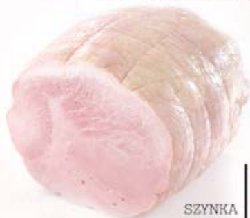
SZYNYKA WŁOSKA 4,0 kg VAC