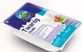
TWARÓG KOSTKA 200G CHUDY, 200 g