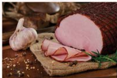
SZYŃKA JAK ZE WSI