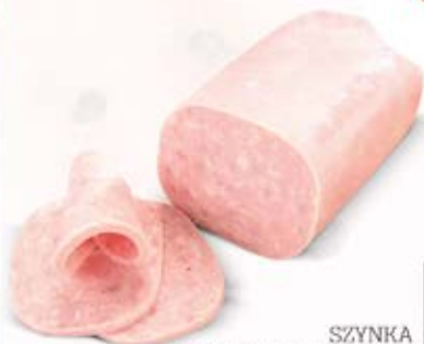
SZYNKA WIEPRZOWA MIELONA