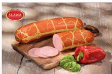
BALERON Z INDYKA