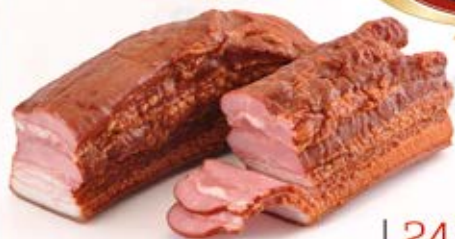
BOCZEK SZLACHECKI PASKI PARZONY