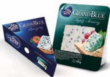
NATUREK KREMOWY GRAND BLUE 100 g