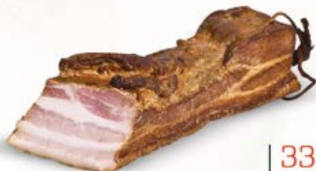
BOCZEK ZE SPIZARNI