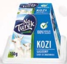
KOZI SEREK W ASORTYMENCIE 150 g