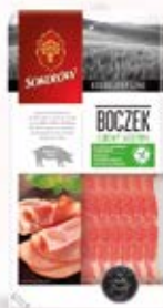
BOCZEK SUROWY WĘDZONY