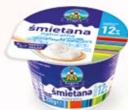
ŚMIETANA 12% 200 g