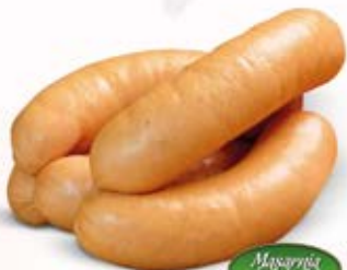
Masarnia Żuławska SERDELKI WIEPRZOWE