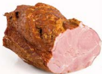
BALERON GOTOWANY 1/2