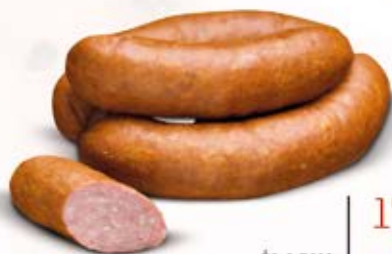
ŚLĄSKA Z WOŁOWINĄ