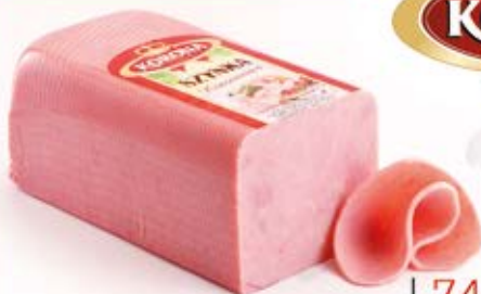
SZYNYKA KONSERWOWA 6 LBS 2,75 kg VAC