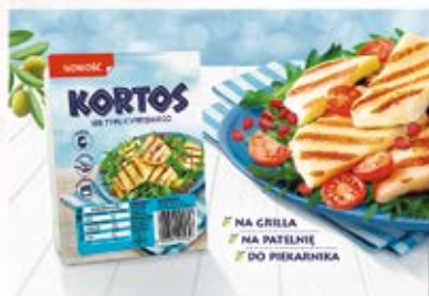
KORTOS 180 G TYPU CYPRYJSKIEGO 100 g