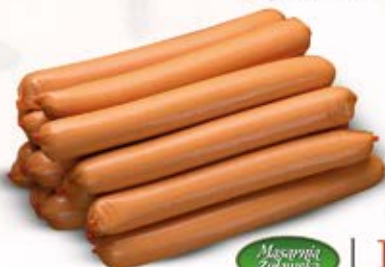
Masarnia Żuławska ELBŁĄZANKI