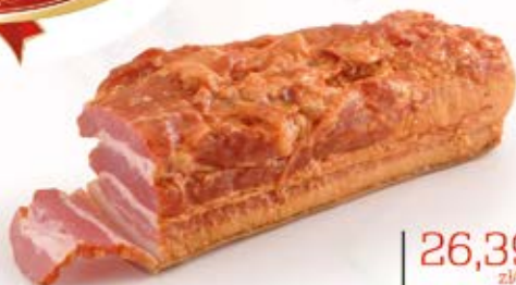
BOCZEK SZLACHECKI PASKI WĘDZONY