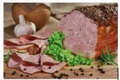
PIECZEŃ Z PIECA