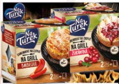
NATUREK GRILL 2X100G W ASORTYMENCIE 2 x 100g