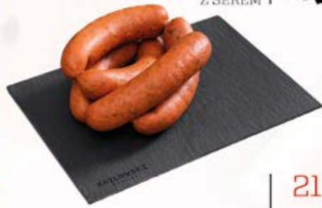
GRILLOWA Z CZOSNKIEM NIEDŹWIEDZIM