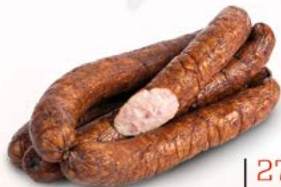
KIEŁBASA ZE SPIŻARNI 0,7 kg MAP