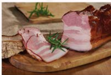
BOCZEK MORAWSKI (PASEK PARZONY, CIEMNO WĘDZONY)