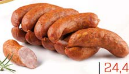
KIEŁBASA DOBRA 1,0 kg MAP