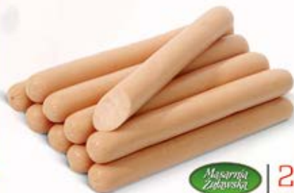
Masarnia Żuławska PARÓWKI Z SZYNKI