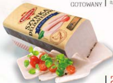
SZYNKA DELIKATESOWA Z KURCZĄT