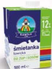
ŚMIETANA 12% 500 ml