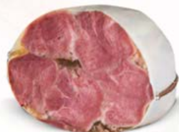
OZORKI GOTOWANE 1,5 kg VAC