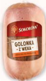
GOLONKA Z WEKA