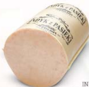
INDYK Z PASIEKI