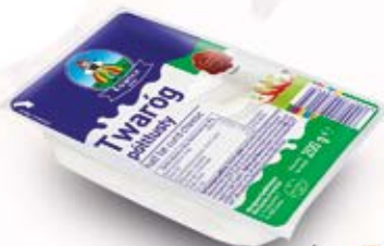
TWARÓG KOSTKA 200G PÓŁTŁUSTY 200 g