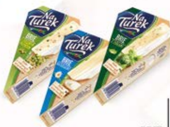
BRIE W ASORTYMENCIE 125 g