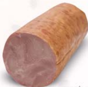
PIECÓWKA Z BOBROWNIK