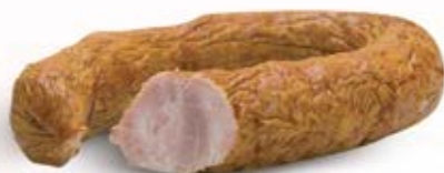
KIELBASA TRADYCYJNIE WYRABIANA