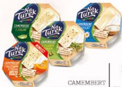
CAMEMBERT W ASORTYMENCIE 120 g