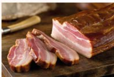
BOCZEK SUROWY WĘDZONY PASEK