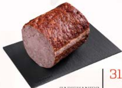
ZAPIEKANIEC MOJEJ BABCI