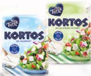
KORTOS 150G 150 g