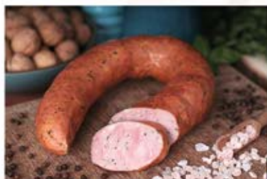
KIEŁBASA GRECKA Z SZYNKI