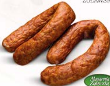
Masarnia Żuławska JAŁOWCOWA ŻUŁAWSKA