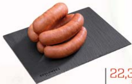
GRILLOWA Z SEREM