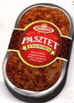
PASZTET Z WĄTRÓBKĄ