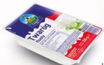
TWARÓG KOSTKA 200G TŁUSTY 200 g