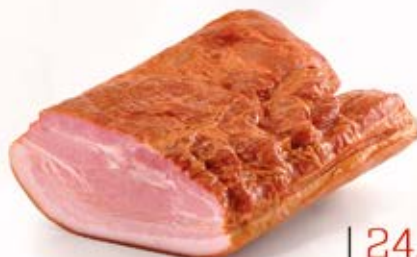
BOCZEK PARZONY EXTRA 1/2 2,0 kg VAC