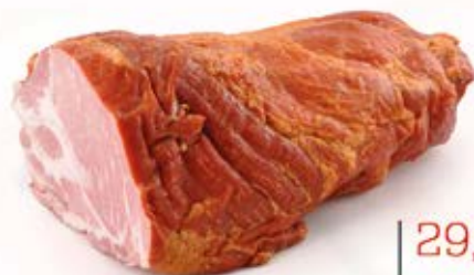
BALERON 1/2 1,5 kg VAC