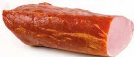
POŁĘDWICA SUROWA WĘDZONA