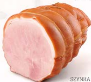
SZYNYKA SZLACHECKA 1,6 kg VAC