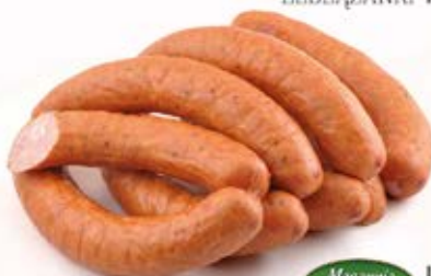
Masarnia Żuławska ŚLĄSKA ŻUŁAWSKA