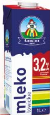
MLEKO 3,2% 1L