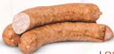
KIELBASA ZWYCZAJNA Z BOBROWNIK