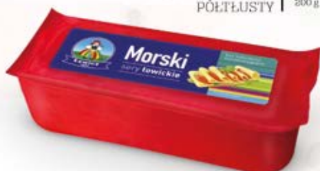
SER MORSKI BLOK