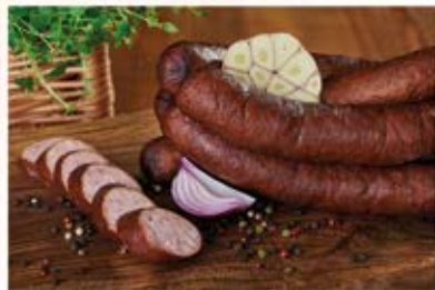
KIEŁBASA PO GÓRALSKU