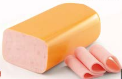
SZYNKĄ Z PIERSIĄ INDYKA