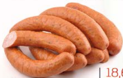
KIEŁBASA ZWYCZAJNA EXTRA