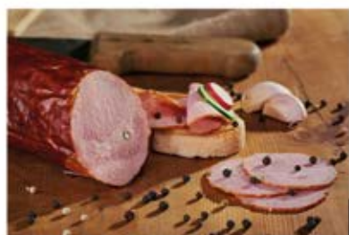
KIEŁBASA SUCHA Z ZIEŁONYM PIEPRZEM