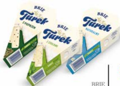
BRIE W ASORTYMENCIE 125 g