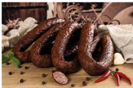
KIEŁBASA WIEJSKA GALICYJSKA