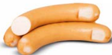
PARÓWKI DROBIOWE Z BOBROWNIK