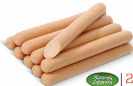
Masarnia Żuławska PARÓWKI Z SZYŃKI