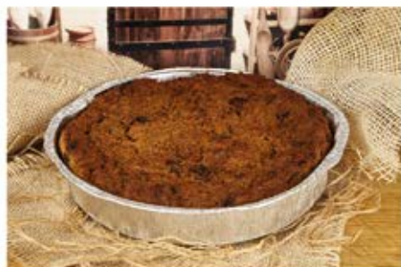
PASZTET Z PIECZONYM POMIDOREM