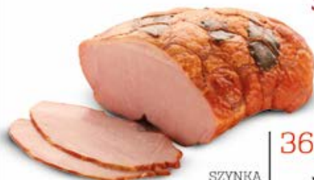
SZYŃKA Z LIŚCIEM