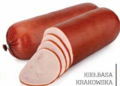
KIEŁBASA KRAKOWSKA Z FILETA