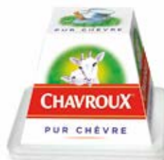
CHAVROUX 150 g