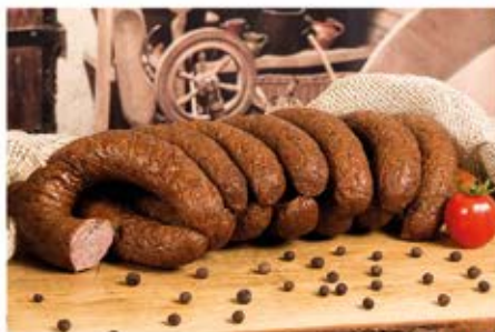
KIELBASA ZE STARÓWKI