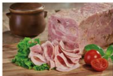
BOCZEK BIAŁY KONSERWOWY