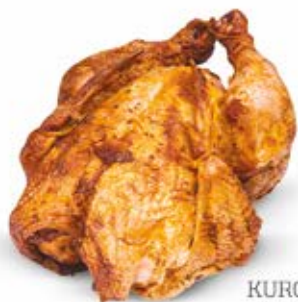
KURCZAK Z RÓŻNĄ