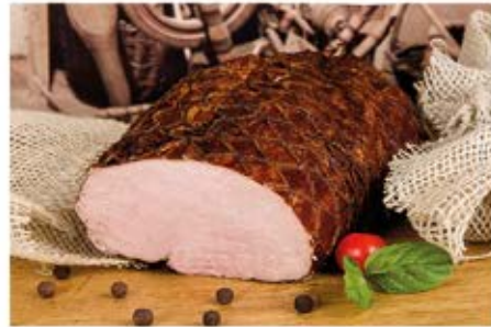
SZYNKĄ Z ZAGRODY