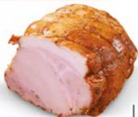
WIEPRZOWINKA Z PIECA