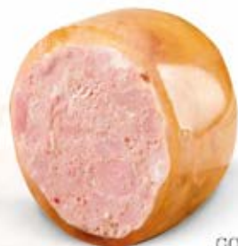
GOLONKA W GALARECIE