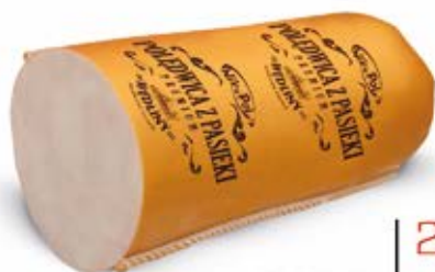
POŁĘDWICA Z PASIEKI