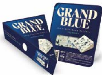
NATUREK KREMOWY GRAND BLUE 100 g