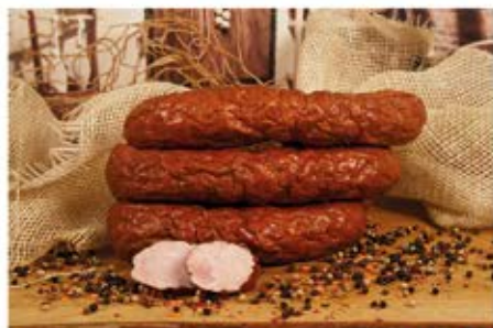
KIEŁBASA PIECZONA SCHABOWA