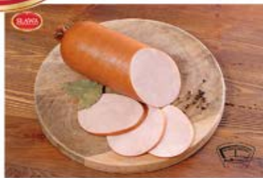
SZYKOWA PEEREŁOWSKA Z FILETA