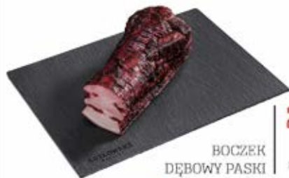
BOCZEK DĘBOWY PASKI