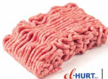
el-HURT Niezawodny Partner MIĘSO NA KOTLETY Z DROBIEM