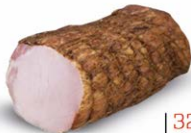
SĘKACZ Z MASARSKIEGO STRAGANU