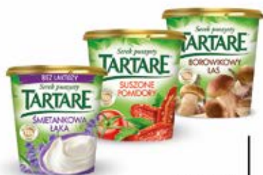
TARTARE W ASORTYMENCIE 140 g