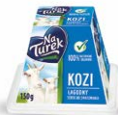
KOZI SEREK W ASORTYMENCIE 150 g