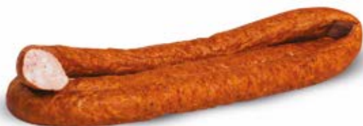
KIEŁBASA PODWAWELSKA FIRMOWA