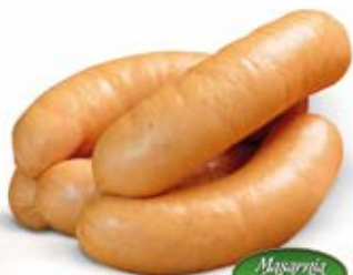
Masarnia Żuławska SERDELKI WIEPRZOWE