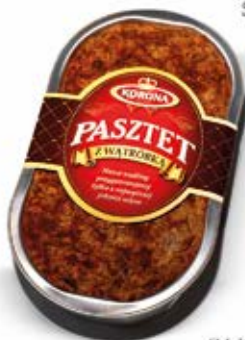
PASZTET Z WĄTRÓBKĄ