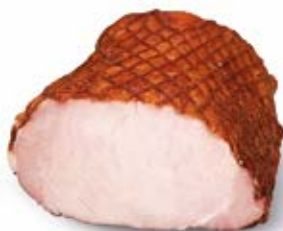
SCHAB Z MASARSKIEGO STRAGANU