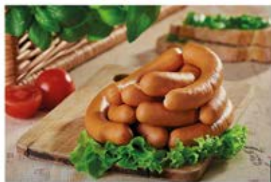
WINERKI Z SZYNKI