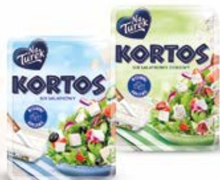
KORTOS W ASORTYMENCIE 160 g