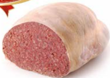
KASZANKA NA PATELNIĘ