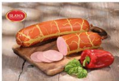
BALERON Z INDYKA