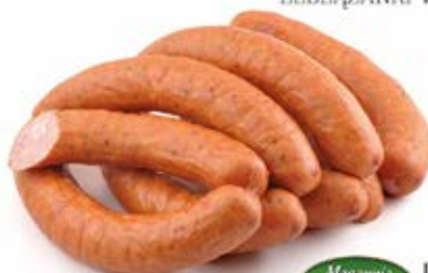
Masarnia Żuławska ŚLĄSKA ŻUŁAWSKA