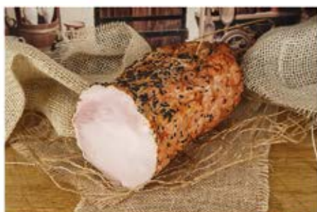
SCHAB NA MAŚLE Z CZARNUSZKĄ