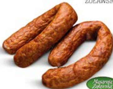
Masarnia Żuławska JAŁOWCOWA ŻUŁAWSKA