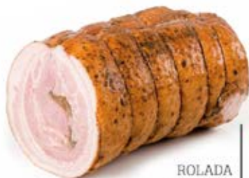
ROLADA Z BOCZKU