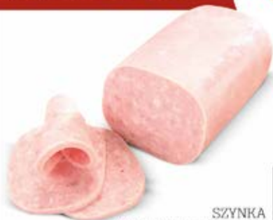
SZYŃKA WIEPRZOWA MIELONA