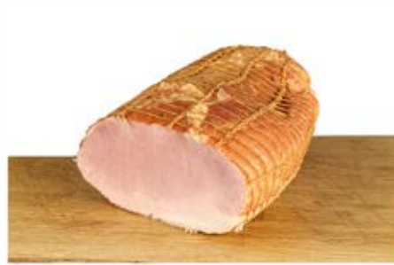
SZYNKĄ Z TŁUSZCZYKIEM