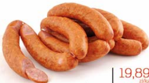
KIEŁBASA ŚLĄSKA REGIONALNA