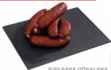
KIELBASA GÓRALSKA PIECZONA