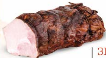
SCHAB NA KARTKI