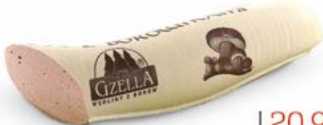
PASZTET Z BOROWIKAMI