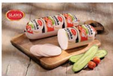
SZYŃKA BIAŁA Z INDYKA