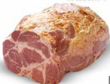
KARCZEK PIECZONY Z BOBROWNIK