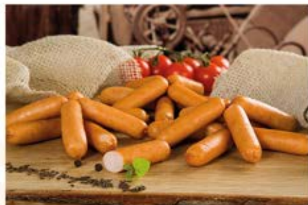
PALUSZKI Z FILETA