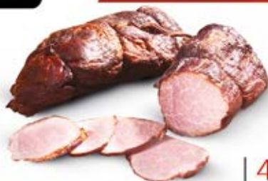
POŁĘDWICZKA ZE SPICHRZA