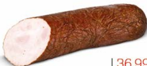
KRAKOWSKA PIECZONA ZE SPICHRZA