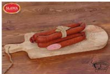
KIELBASA PEEREŁOWSKA Z INDYKA