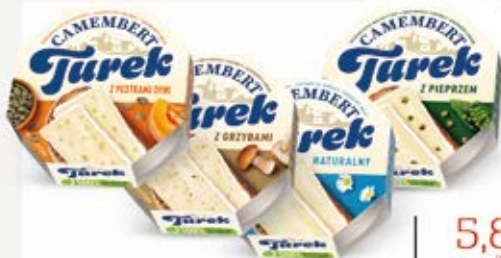
CAMEMBERT W ASORTYMENCIE 120 g