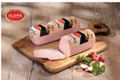
SŁAWSKA Z INDYKA