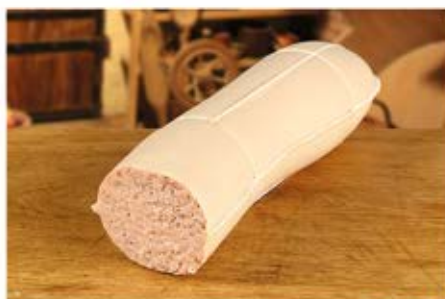
PASZTET Z BOCZKIEM