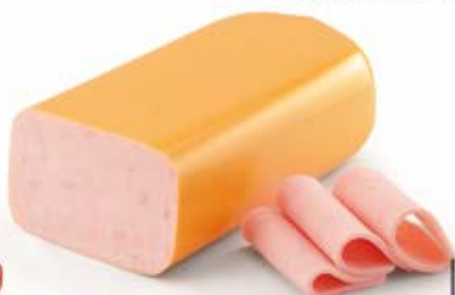
SZYŃKA Z PIERSIĄ INDYKA