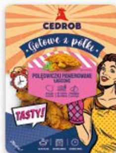
POŁĘDWICZKI Z KURCZAKA PANIEROWANE ŁAGODNE