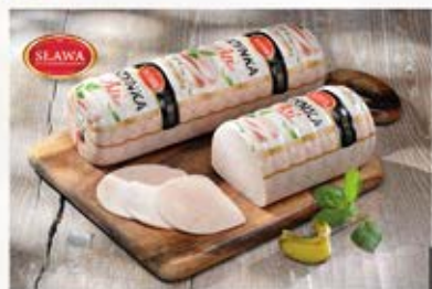
SZYŃKA ASI Z KURCZAKA