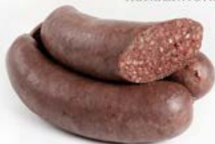
KASZANKA Z CZOSNKIEM