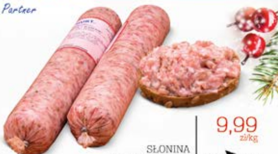
SŁONINA Z PRYZPRAWAMI