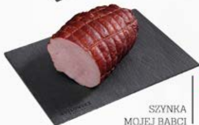
SZYNKA MOJEJ BABCI