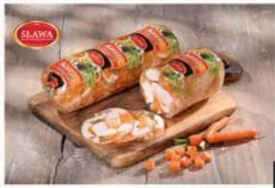
KURA W GALARECIE