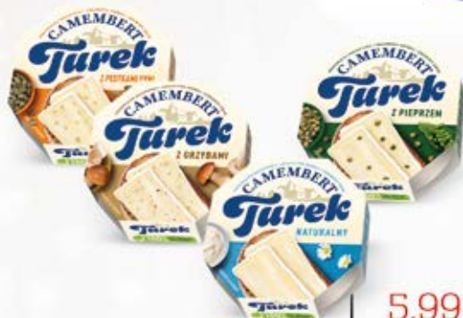
CAMEMBERT W ASORTYMENCIE 120 g