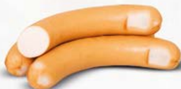
PARÓWKI DROBIOWE Z BOBROWNIK