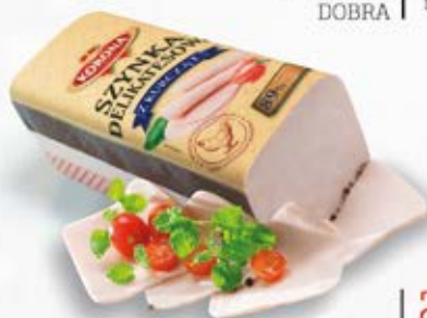
SZYNYKA DELIKATESOWA Z KURCZĄT