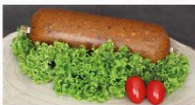
GROCHÓWKA, FLAKI WOŁOWE, BIGOS