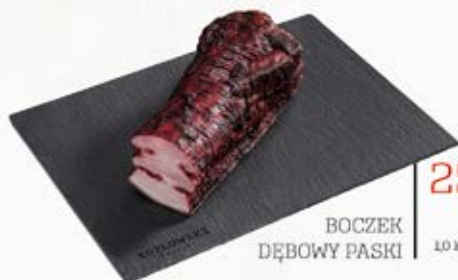
BOCZEK DĘBOWY PASKI