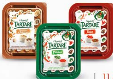
TARTARE L'APERITIF WŁOSKI, PROWANSALSKI, Z ORZECHAMI 100 g