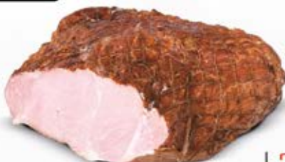
PAJDA Z MASARSKIEGO STRAGANU