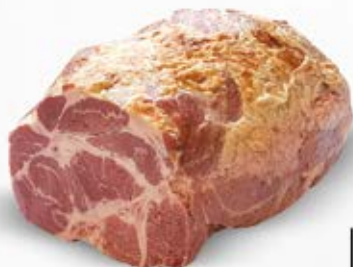
KARCZEK PIECZONY Z BOBROWNIK