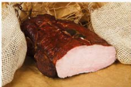
SZYNKĄ TRADYCYJNĄ Z LASKOWEJ