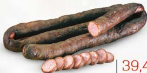
KIEŁBASA ZE SPICCHRZA