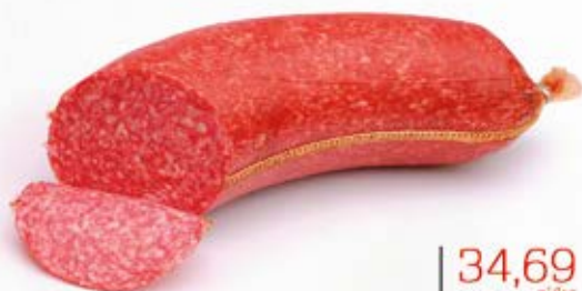
SALAMI BOOMERANG PREMIUM