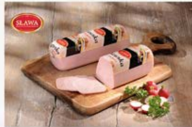
SŁAWSKA Z INDYKA