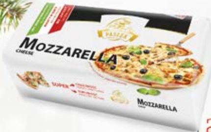
MOZZARELLA BLOK 1 kg