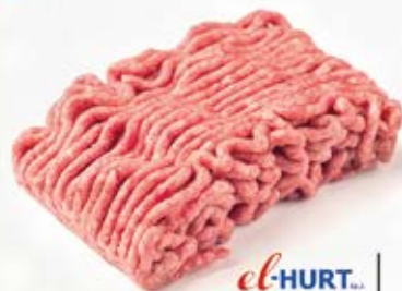
el-HURT Niezawodny Partner MIĘSO NA KOTLETY Z DROBIEM