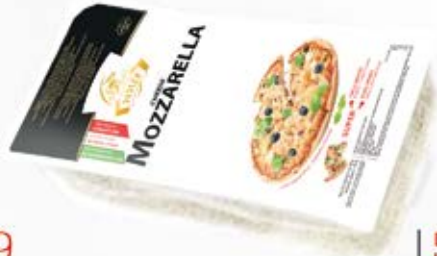
SER MOZZARELLA KOSTKA 2 kg