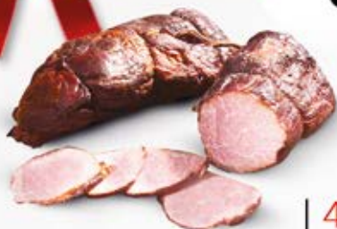
POŁĘDWICZKA ZE SPICHRZA