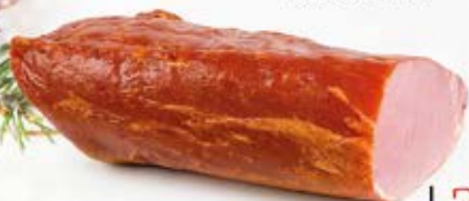
POŁĘDWICA SUROWA WĘDZONA