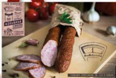
KIEŁBASA Z KACZKĄ