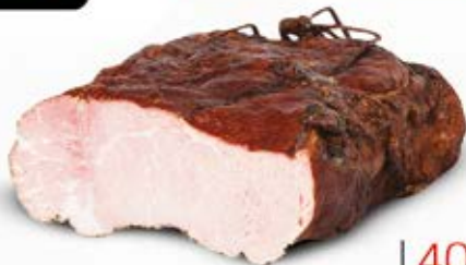
SZYŃKA Z WĘDZOKA