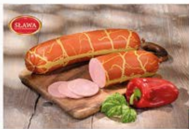
BALERON Z INDYKA