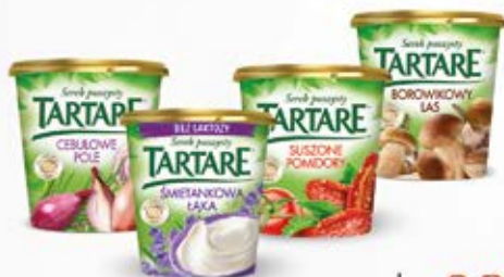
TARTARE W ASORTYMENCIE 140 g