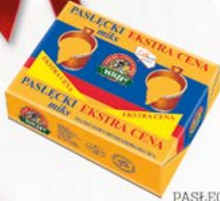
PASLECKI MIKS 200 g