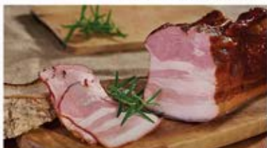
BOCZEK MORAWSKI (PASEK PARZONY, CIEMNO WĘDZONY)