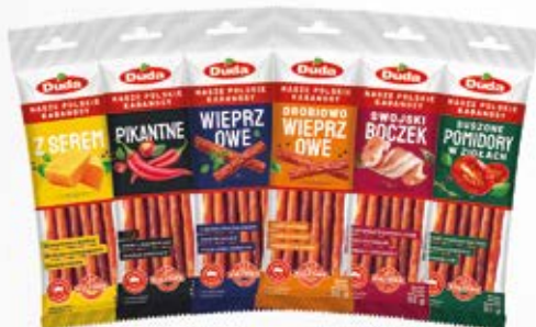
KABANOSY W ASORTYMENCIE