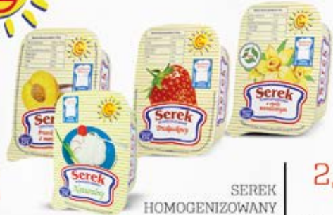
SEREK HOMOGENIZOWANY W ASORTYMENCIE 200 g