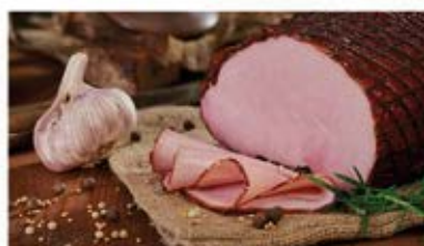
SZYŃKA JAK ZE WSI