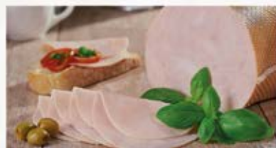
KURCZAK GOTOWANY PREMIUM