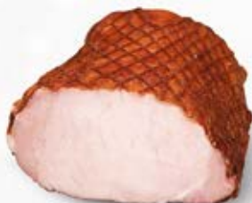
SCHAB Z MASARSKIEGO STRAGANU