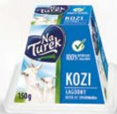
KOZI SEREK W ASORTYMENCIE 150 g