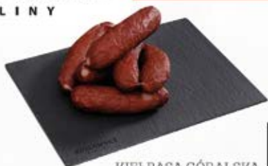
KIEŁBASA GÓRSKA PIECZONA