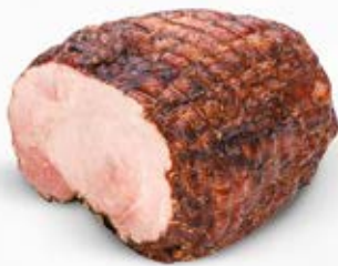
SZYNKA WĘDZONA TRADYCYJNA