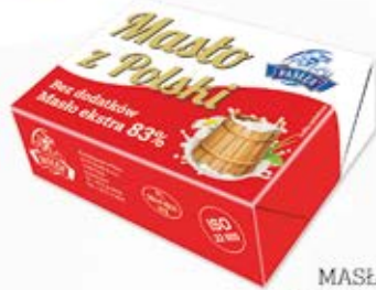
MASŁO Z POLSKI 200 g