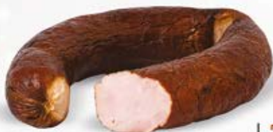
LISÓWKA SUCHA WIEPRZOWA