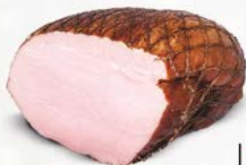
SZTUKA MIĘSA Z MASARSKIEGO STRAGANU