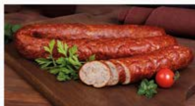
KIEŁBASA KRUCHA Z CIELECINĄ