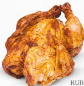
KURCZAK Z ROŻNA