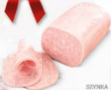
SZYŃKA WIEPRZOWA MIELONA