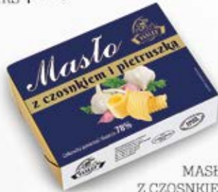
MASŁO Z CZOSNKIEM 150 g