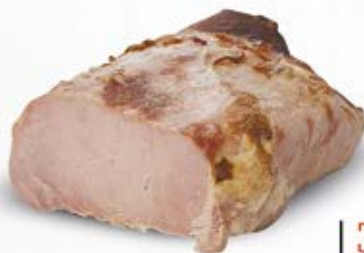
SCHAB PIECZONY Z BOBROWNIK