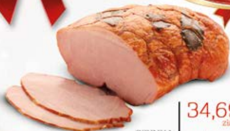
SZYŃKA Z LIŚCIEM