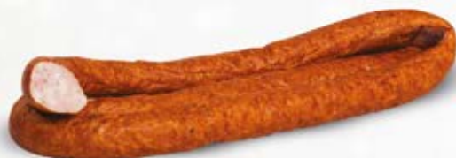
KIELBASA PODWAWELSKA FIRMOWA