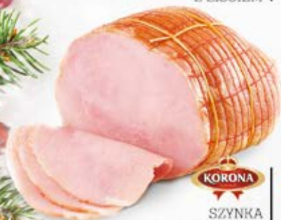
KORONA SZYŃKA DELIKATESOWA