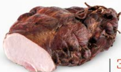
SZYŃKA NA KARTKI