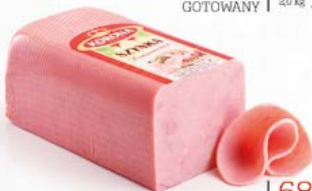
SZYNYKA KONSERWOWA 6 LBS