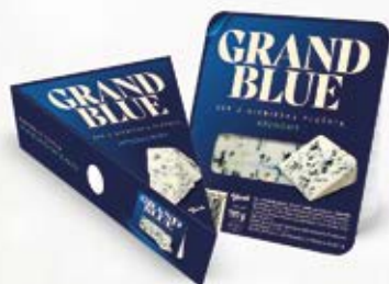
NATUREK KREMOWY GRAND BLUE 100 g