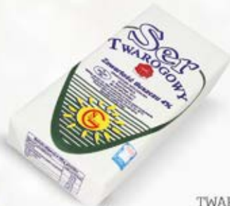
TWARÓG PÓTEŁUSTY KRAJANKA 1 kg