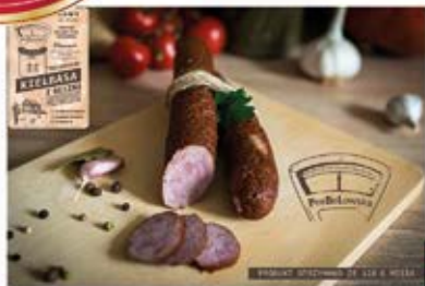
KIEŁBASA Z GĘSINĄ