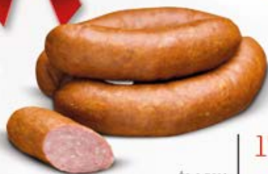
ŚLĄSKA Z WOŁOWINĄ