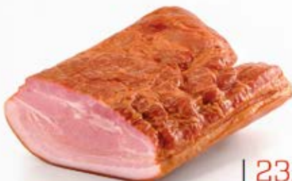
BOCZEK PARZONY EXTRA 1/2