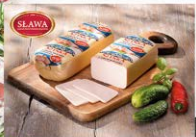
SZYŃKA Z PIERSI KURCZAKA PRASOWANA