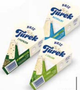
BRIE W ASORTYMENCIE 125 g